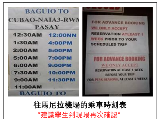
往馬尼拉機場的乘車時刻表